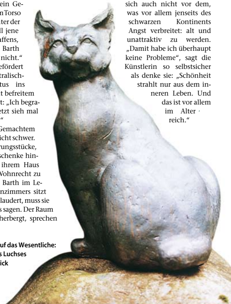
Reduktion auf das Wesentliche: Der Blick des Luchses fängt den Blick

Das alles kann Anna Barth längst nicht mehr ängstigen. Sie fürchtet sich auch nicht vor dem, was vor allem jenseits des schwarzen Kontinents Angst verbreitet: alt und unattraktiv zu werden. „Damit habe ich überhaupt keine Probleme“, sagt die Künstlerin so selbstsicher als denke sie: „Schönheit strahlt nur aus dem inneren Leben. Und das ist vor allem im Alter reich.“