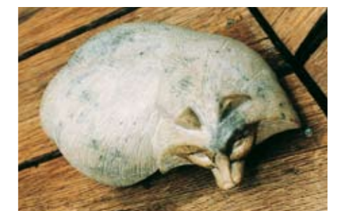
Eleganz, Symmetrie und Körpersprache des Wildes bringt Anna Barth in ihren Plastiken und Skulpturen mit minimalen Mitteln zum Ausdruck