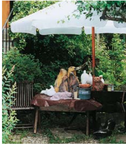
Arbeitsplatz unter freiem Himmel: Im Garten formt Anna Barth ihre Skulpturen