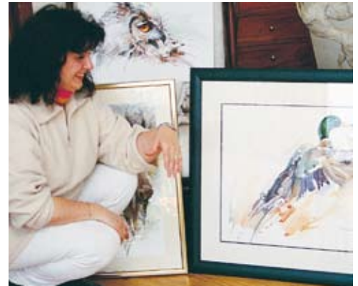
Mit ihren Bildern feiert Nicole van Axx in den USA ihre größten Erfolge