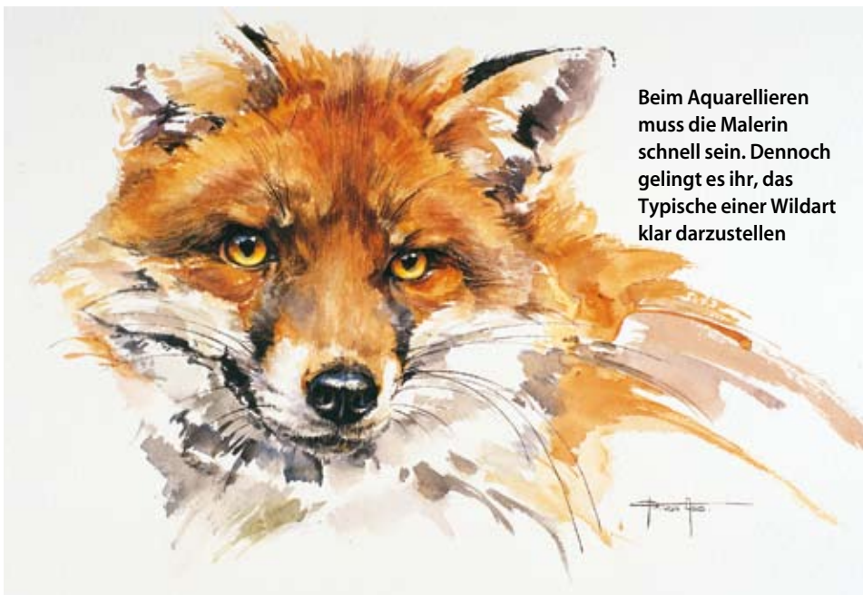
Beim Aquarellieren muss die Malerin schnell sein. Dennoch gelingt es ihr, das Typische einer Wildart klar darzustellen